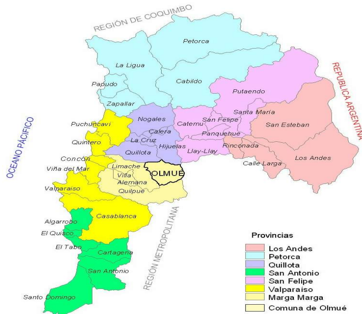
MAPA N°1. Ubicación de la Comuna de Olmué en la Región de Valparaíso

http://www.senado.cl/prontus_galeria_noticias/site/artic/20080122/pags/20080122124837.html